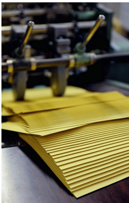
Die VetroMobil-Hängemappen werden ebenfalls in Biel produziert.

Biella produziert in Brügg jährlich über 13 Millionen Ordner. Auf zwei Ordnerlinien fliesen im Sekundentakt die traditionell mit Kipp-Hebelmechanik, Griffloch und Raumsparösen gefertigten Ordner vom Band. Die meisten Aufträge werden «Just in Time» hergestellt und gehen ohne Lagerzeiten direkt auf den LKW und zum Kunden. In den Maschinenpark wird laufend investiert. Als neuste grössere Investition steht eine automatische Boxenverpackung.