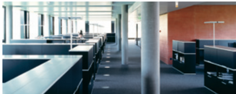
Ordnung schafft Platz am Arbeitsplatz, das richtige System eine optimale Raumnutzung.

Durchschnittlich 20 Prozent unserer wertvollen Arbeitszeit verbringen wir mit Suchen und Ordnen von Geschäftsakten. Der Papierberg fordert immer mehr Platz im Büro. Eine flüssige Organisation sorgt für eine rationelle Bewirtschaftung der Unterlagen, bringt Kosteneinsparungen, verbesserte Produktivität und Zeitgewinn für mehr Kreativität.